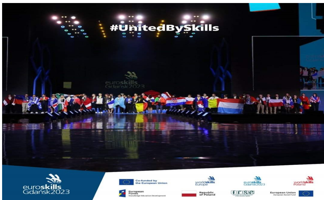
Prezentacja uczestników olimpiady podczas ceremonii otwarcia.