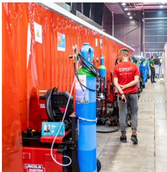
Ekspert pilnuje wykonywania projektu.