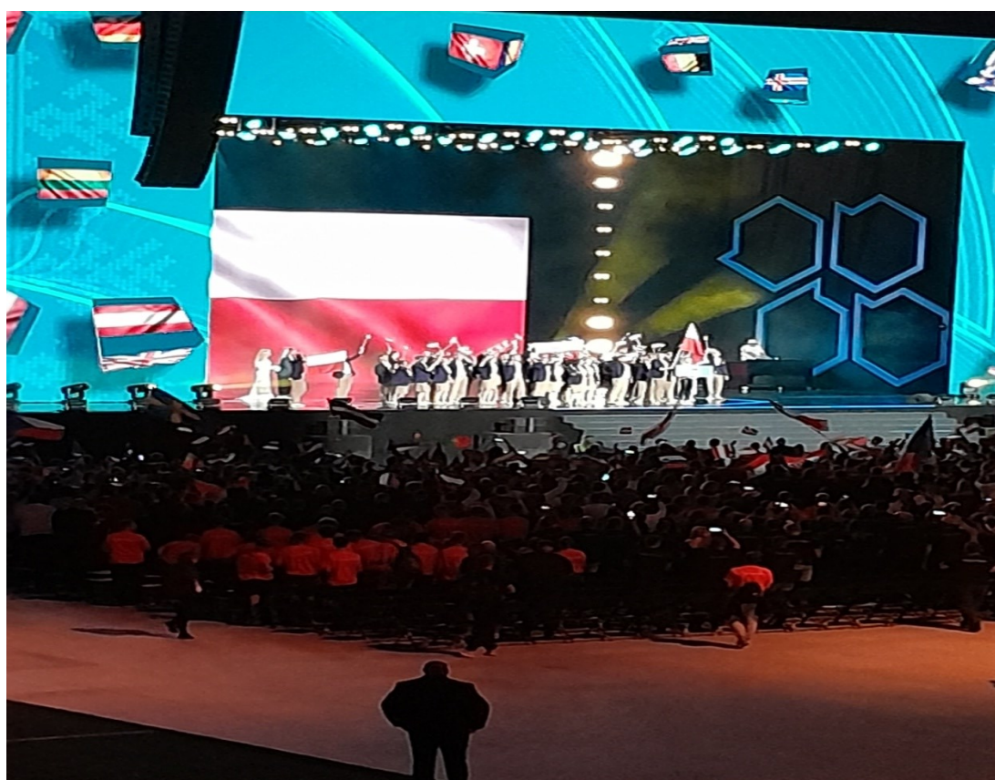
Prezentacja polskich zawodników podczas ceremonii otwarcia.