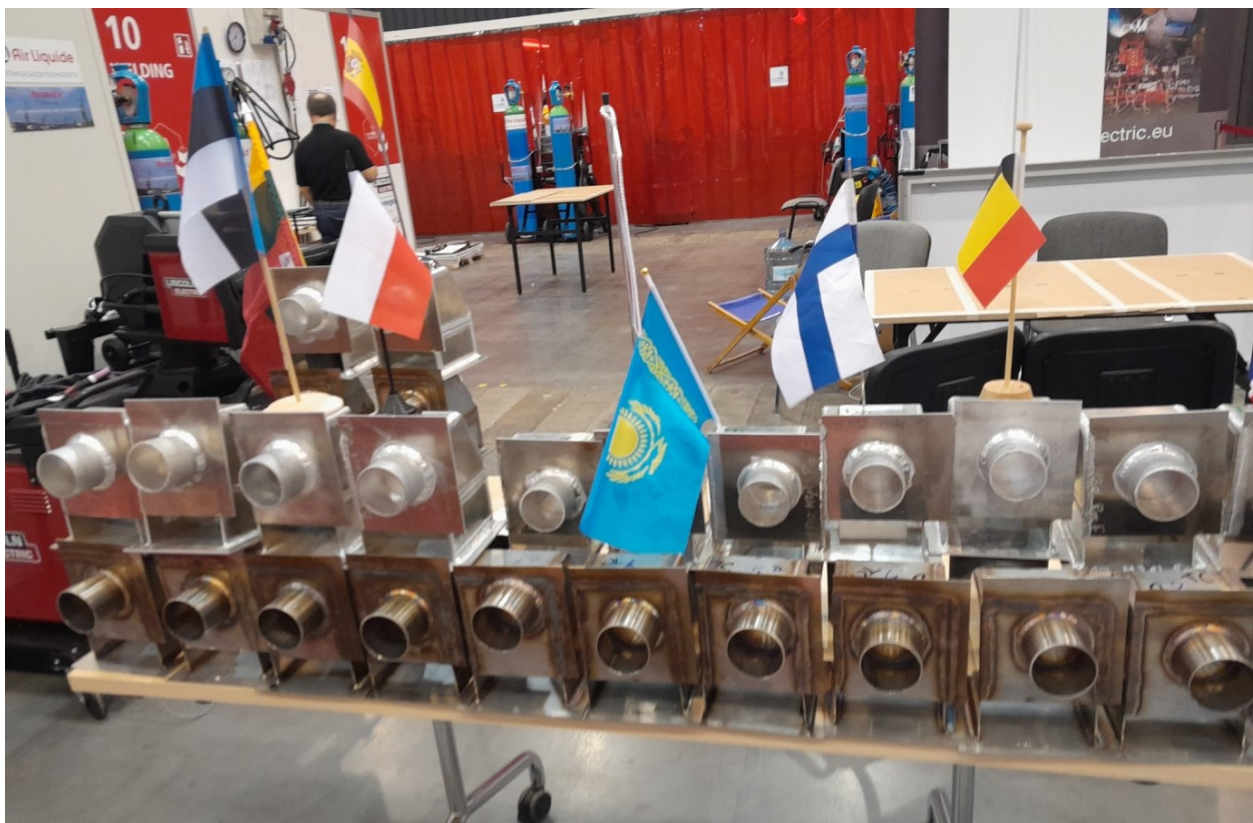
Zakończone zadanie nr 2 i 3 w projekcie.