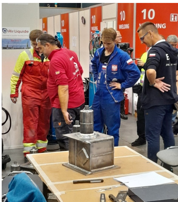
Oczekiwanie na ocenę projektu i wyniki konkurencji.