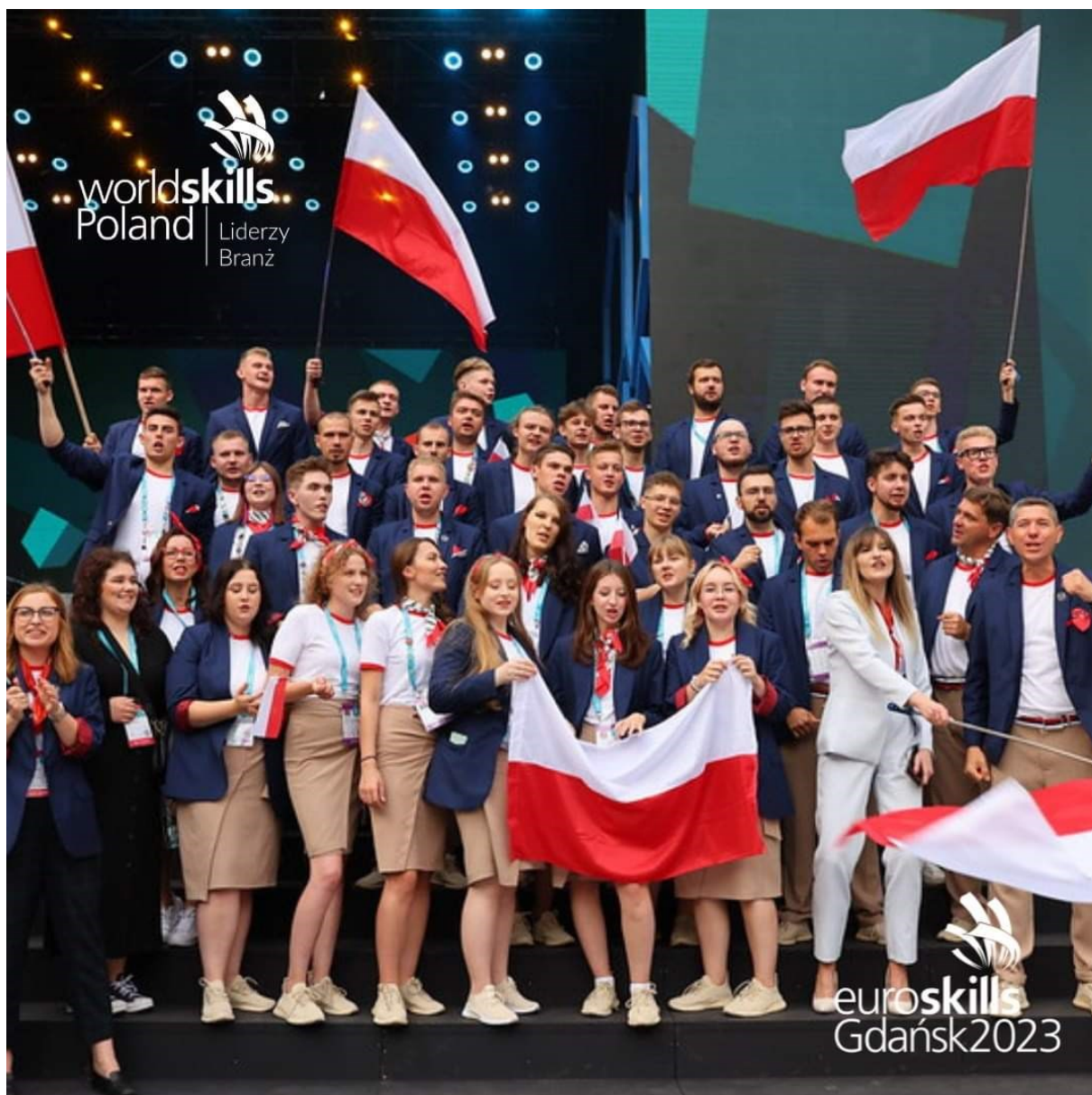
Reprezentacja Polski na EuroSkills'23 w Gdańsku.

Zawody w poszczególnych konkurencjach odbyły się na terenie AMBER EXPO i stadionie ARENA POLSAT PLUS. Rozmieszczenie poszczególnych warsztatów pokazuje poniższa mapa.