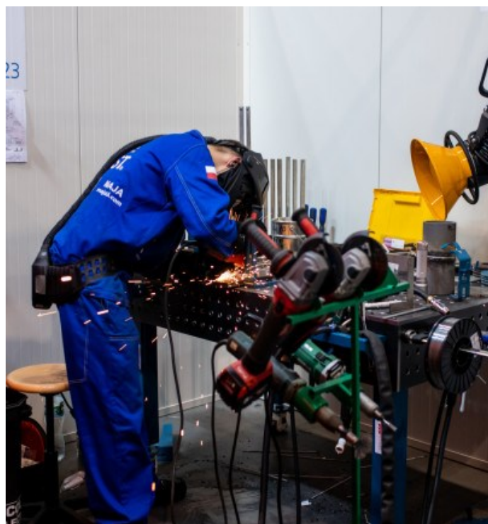
Wykonanie projektu.

Zawodnicy otrzymali do wykonania projekt podobny do poprzednich czyli składający się z czterech modułów i limit czasowy 19 godzin na jego wykonanie. Poniżej kilka zdjęć z przebiegu zawodów.